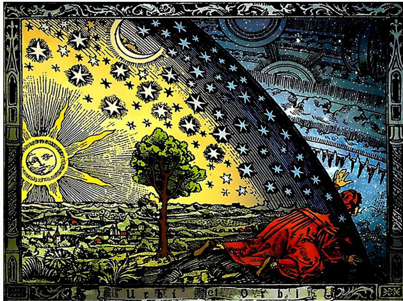
Grabado de Flammarion, 1888